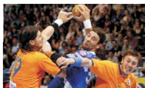
Sport Manager Personal Training